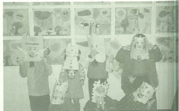
美術班學員戴上自行製作的面具合影於本會會館

由本會主辦的社區藝文學苑，計有成人陶藝班、成人插花班、兒童美術班、兒童書法班，熱烈招生中！ 以上活動意者請洽本會